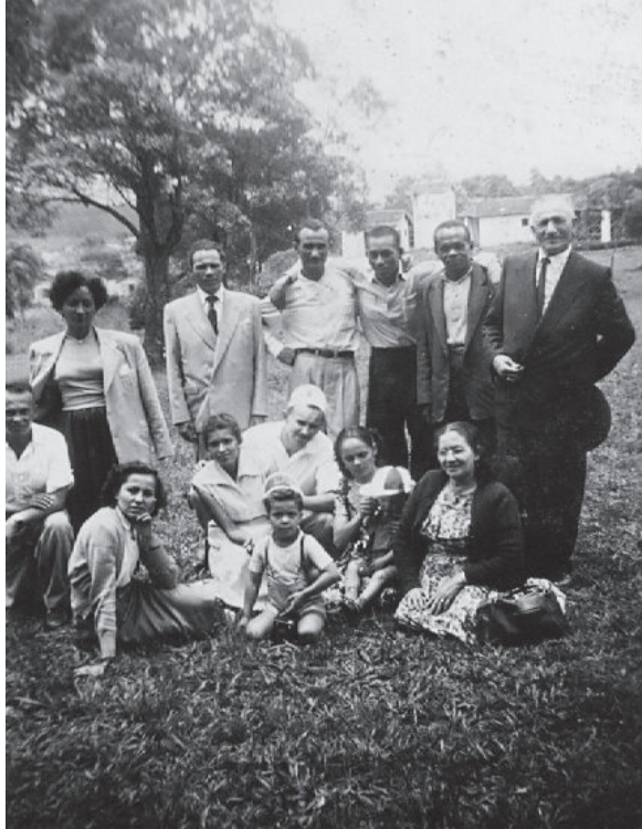
Convescote promovido pela Brasil Unido na Vila Galvão (Guarulhos), em 1953. Eventos dessa natureza estavam entre as principais iniciativas organizadas por sua Comissão de Festas para arrecadar fundos para os cofres da entidade