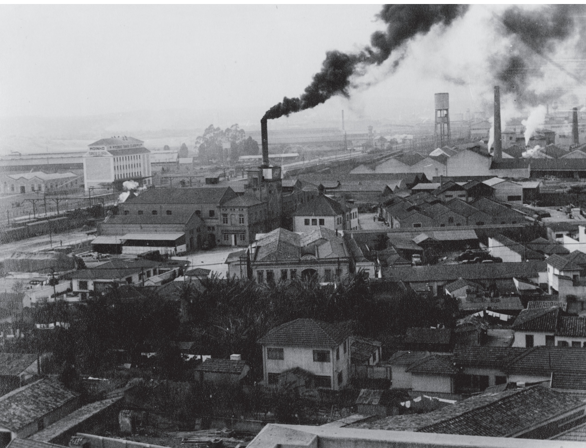
Aspecto de indústrias de São Caetano, na década de 1950. Destacam-se, à esquerda, o Moinho Santa Clara e a Refinadora de Óleos Brasil. Ao fundo, a General Motors. O crescimento da industrialização, no período, contribuiu para que o município adquirisse perfil de subúrbio operário, tornando-o polo de atração da mão de obra migrante