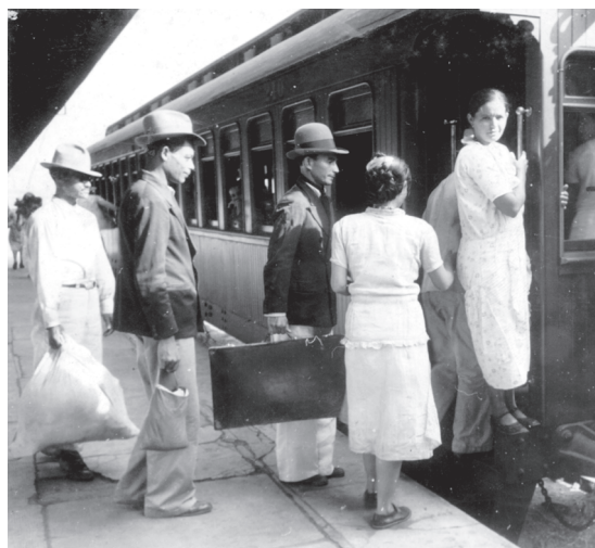
Migrantes embarcando, na estação da Hospedaria de Imigrantes, rumo às fazendas de café e algodão do interior do Estado de São Paulo, em 1939