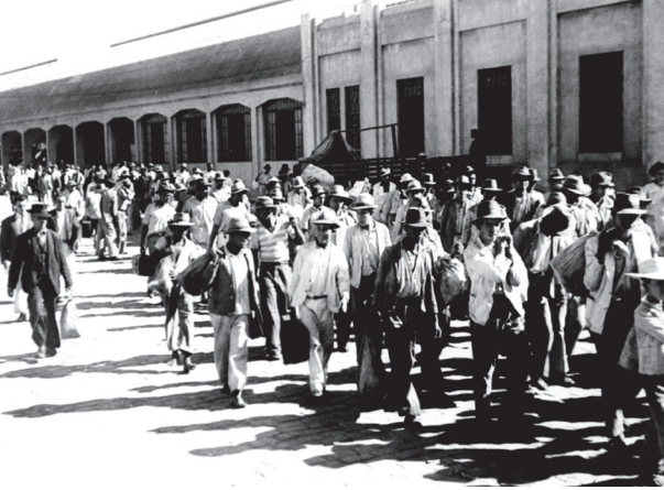
Grupo de migrantes nordestinos recém-chegados à Estação do Norte (atual Estação Roosevelt), em São Paulo, em 1939. Dessa estação, os migrantes seguiam em direção à Hospedaria de Imigrantes